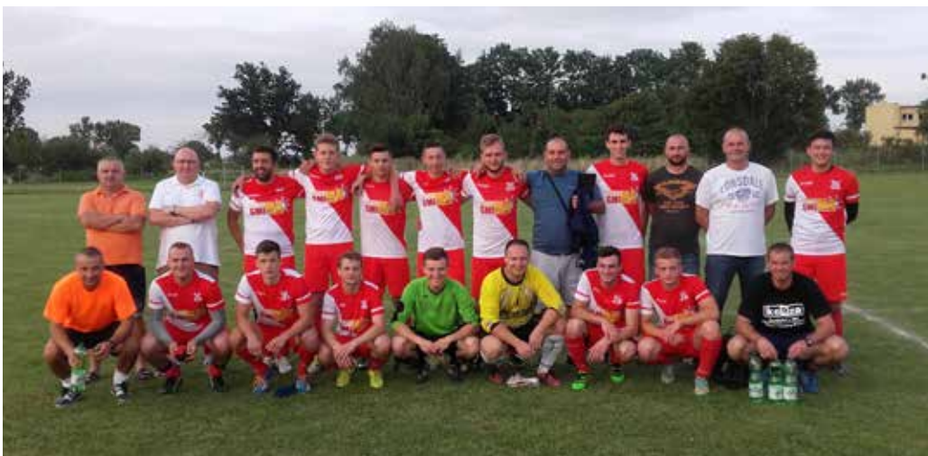
Drużyna Piasta z trenerami i działaczami

W trakcie rozgrywanych meczów nasi zawodnicy strzelili 77 bramek i stracili 49. Wygraliśmy 17 meczów, zremisowaliśmy 8, a przegraliśmy 5. Statystyka jasno pokazuje, że z każdym sezonem idziemy do przodu i od pamiętnego sierpnia 2015 roku, kiedy naprawdę nikt nie wiedział, co z nami będzie, dziś udowadniamy, że daliśmy radę. Przekonaliśmy tych, którzy nie wierzyli, że jeśli robi się to, co kocha i z hobbistycznym zamiłowaniem, to musi się udać. Przez te dwa lata dużo się zmieniło. Nowy start zaczynaliśmy z założeniem utrzymania się w lidze, co w sezonie 2015/2016 przy reorganizacji ligi nie było łatwym zadaniem. Po wywalczeniu tego celu nadszedł czas na odbudowanie wizerunku i walkę o cenne punkty plasujące nasz klub w coraz wyższych miejscach tabeli sezonu 2016/2017. Pierwszym sukcesem był remis 17 kolejki z pretendencją do awansu do 4 ligi Orkanem Buczek 2:2. Wystarczy spojrzeć na pozostałe wyniki tej drużyny, żeby ocenić skalę odniesionego sukcesu. W kolejce 21 nasza drużyna wyjeżdżała do jednego z najbardziej oddalonych rywali tj. do Czarnych Rzańnia, gdzie zawodnicy PIASTA po ciężkiej walce pokonali wynikiem 2:1 drugiego pretendenta do awansu 4 ligi. Ten mecz z perspektywy czasu rozstrzygnął o awansie do 4 ligi. Od tamtej pory drużyna z Rzańni grała już nie tę piłkę. Kolejne mecze przynosiły zwycięstwa i remisy oraz małe potknięcia zakończone