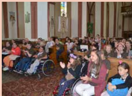
Uczestnicy wczasorekolekcji w wojkowskim kościele

Poczęcia NMP w Wojkowie. Wraz z parafianami wyremontował opuszczoną organistówkę i zorganizował w niej pierwsze spotkanie dla osób niepełnosprawnych z parafii i okolic. Przez kolejne lata duszpasterze z młodzieżą i powstałym Katolickim Stowarzyszeniem „Rodzina” kontynuują to dzieło we wspomnianym budynku, który został nazwany Albertówką. MAL