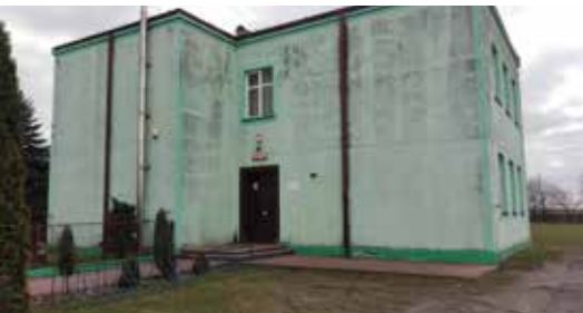
Do szkoły w Łubnej miałyby uczęszczać od września 17 uczniów

Problemy związane z błaszkowską oświatą pomaga samorządowi rozwiązać Ministerstwo Edukacji Narodowej. Jest to szalupa ratunkowa pozwalająca gminie Błazski naprawić wieloletnie zaniedbania i całkiem niedawne błędy.