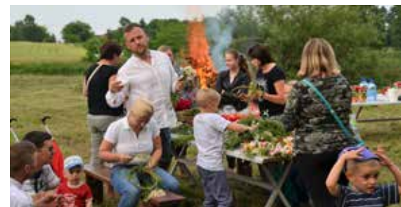
Sobótki nad Stawem Trojana