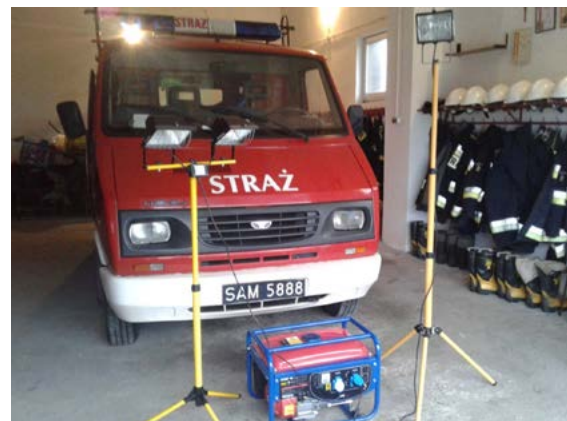
Nowy agregat w Łubnej