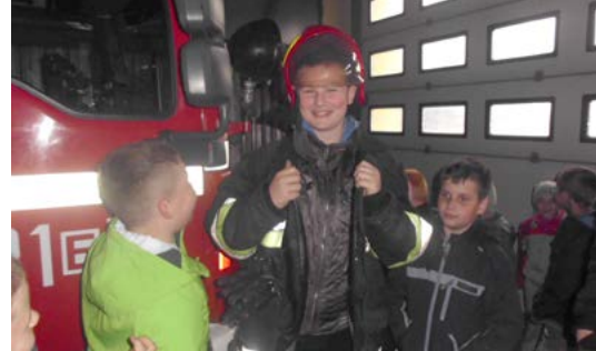
Każdy chciał być strażakiem

Uczniowie wybrali się też na wycieczkę. 17 maja odwiedzili ZOO Safari w Borysewie, gdzie podziwiali ciekawe gatunki zwierząt. Udali się również do Państwowej Straży Pożarnej w Sieradzu. Mogli z bliska obejrzeć wozy strażackie wraz z wyposażeniem i sprzęt do gaszenia pożarów. Dzieci miały także okazję zasiąść za kierownicą wozu strażackiego, przymierzyć hełm i mundur strażacki. Dowiedziały się, jak wygląda praca