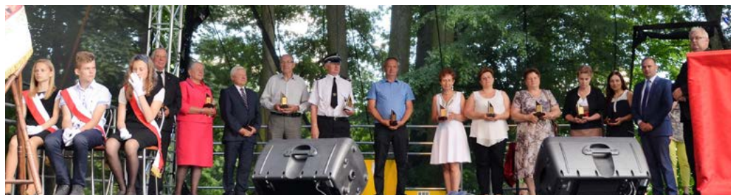
Działający na rzecz rozbudowy szkoły zostali obdarowani statuetkami

Niedziela 12 czerwca 2016 roku zapisała się dla Szkoły Podstawowej im. Jana Pawła II w Gruszczykach jako wyjątkowa. Odbędzie się ważna uroczystość, na którą złożyły się 3 wydarzenia: 30-lecie działalności Szkoły Podstawowej w Gruszczykach, XXXIII Ogólnopolskie Biegi Przetajowe im. Elżbiety Katolik i Festyn Rodzinny „U progu lata”.