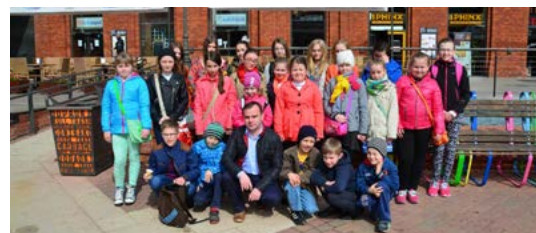
Dzieci skorzystały z wyjazdu do łódzkiego Arlekina