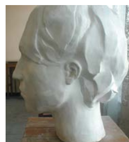
Jedna z nagrodzonych rzeźb