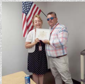
Chłopak z ulicy Kościuszki w Błaszki kończy I semestr w Glendale Community College