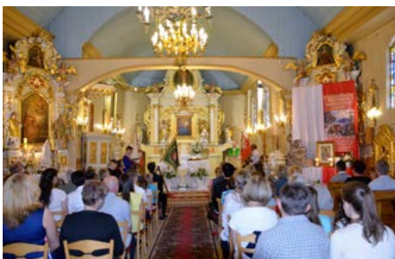
Uczestnicy uroczystości skupili się w gruszczyckiej świątyni