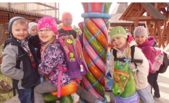
Pobyt w ZOO Safari dostarczył dzieciom wielu emocji

Uczniowie ze Szkoły Podstawowej w Łubnej-Jakusach wypełnili maj nie tylko nauką, ale ciekawymi inicjatywami. Działali na rzecz środowiska, uczyli się o bezpieczeństwie, zachęcali w ramach Dni Otwartych do poznania swojej szkoły.