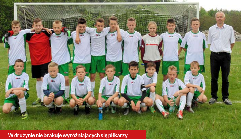
W drużynie nie brakuje wyróżniających się piłkarzy