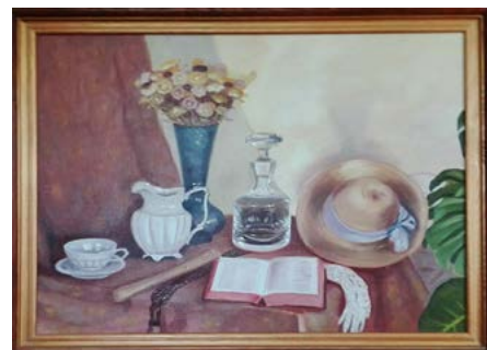
Martwa natura z kapeluszem