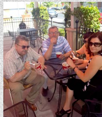
Czas na smaczne lody