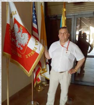
Błaszkwianin chętnie działa w Kongresie Polonii Amerykańskiej