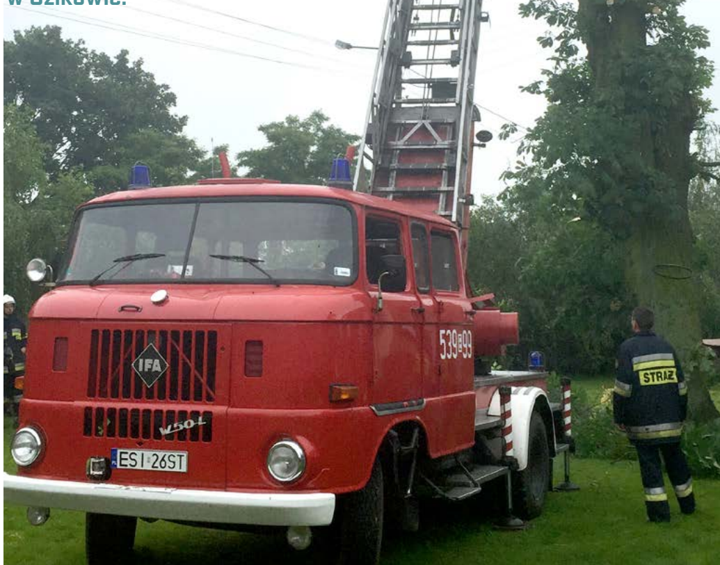
Złoczewski samochód OSP z podnośnikiem i koszem przy drzewie w Gzikowie tuż przed groźnym wypadkiem