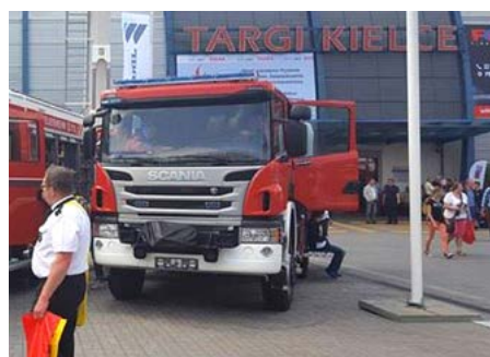
Na kieleckiej wystawie nasze auta prezentowały się znakomicie