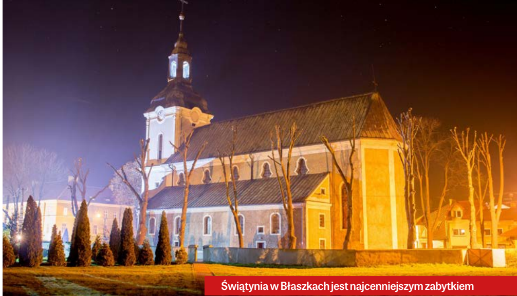
Świątynia w Błaszczach jest najcenniejszym zabytkiem

Gdy 8 lat temu zostałem proboszczem parafii św. Anny w Błaszczach spoczęła na mnie odpowiedzialność za jej wymiar duchowy i materialny. O tym pierwszym pisałem w poprzednim numerze „Kuriera Błaszczowskiego”, omawiając istniejące w naszej parafii grupy i wspólnoty. Teraz pragnę podzielić się z Czytelnikami informacjami na temat dóbr materialnych w błaszczowskiej parafii.